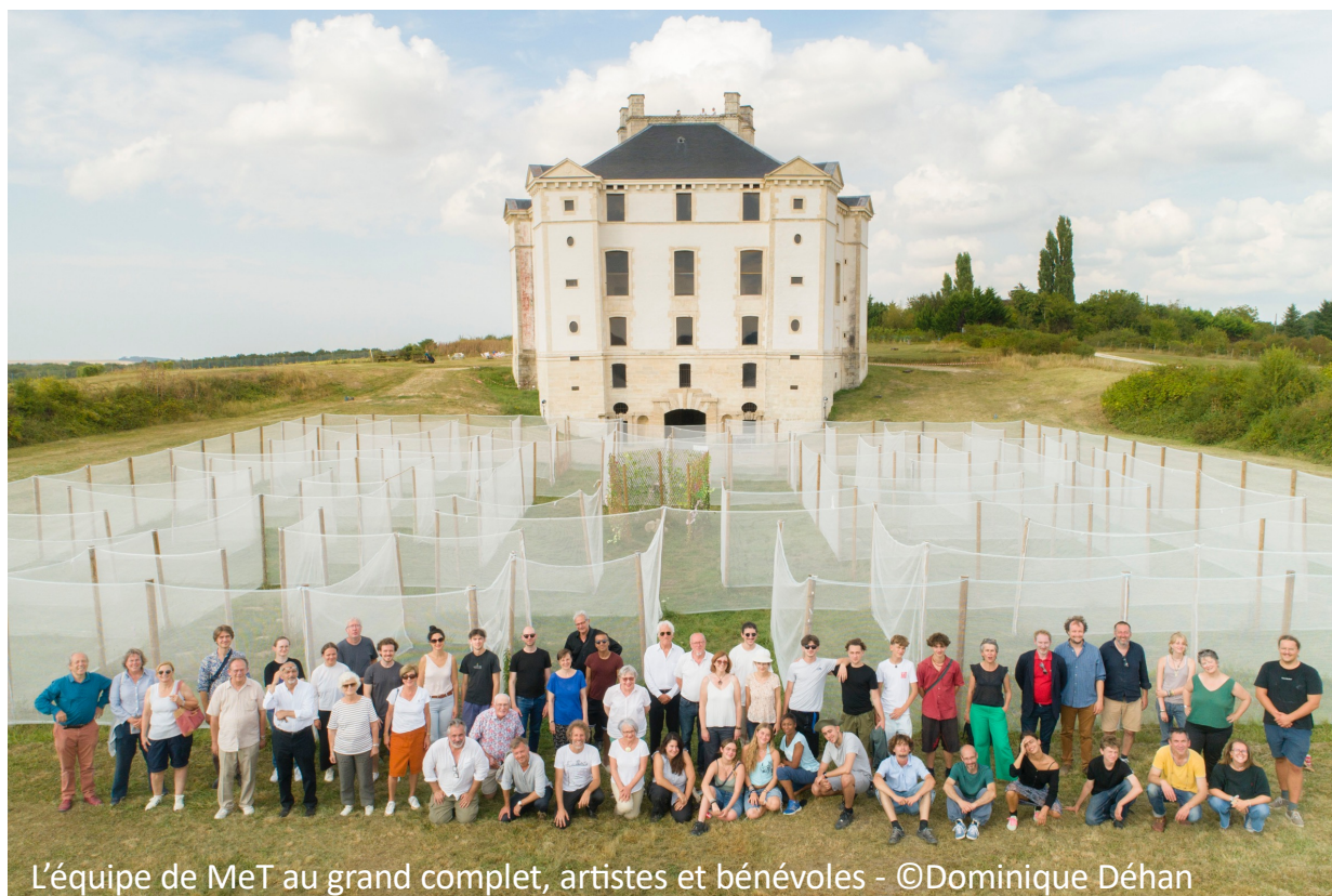
L'équipe de MeT au grand complet, artistes et bénévoles